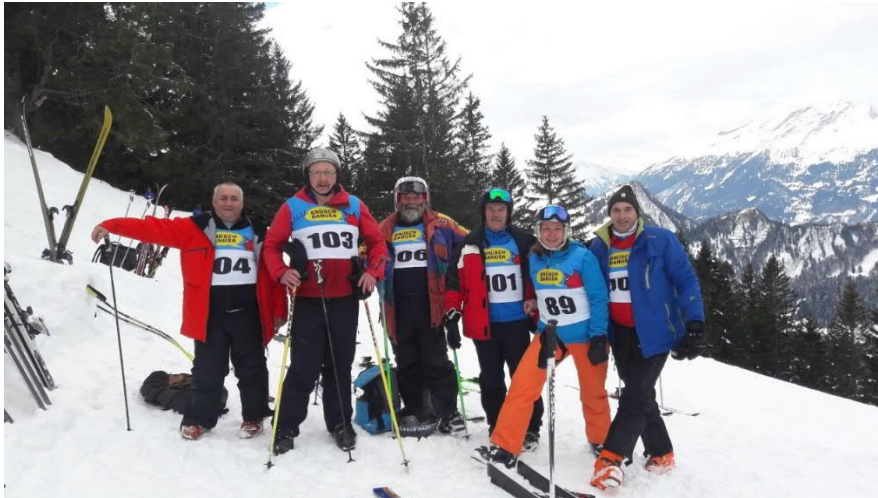
ESV-Team am Riesenslalom in Grüşch

Leider finden pro Saison nur noch 4 Regionalrennen (Schwende AI, Grüşch-Danusa, Amden und Engelberg) statt, an welchen wir mit jeweils 2 – 8 Teilnehmer am Start waren.