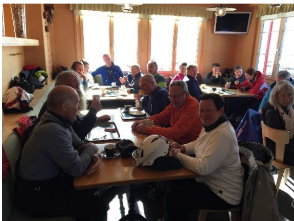
Die Stärkung vor dem Rennen.