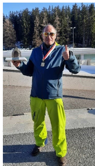
So sehen Sieger aus.