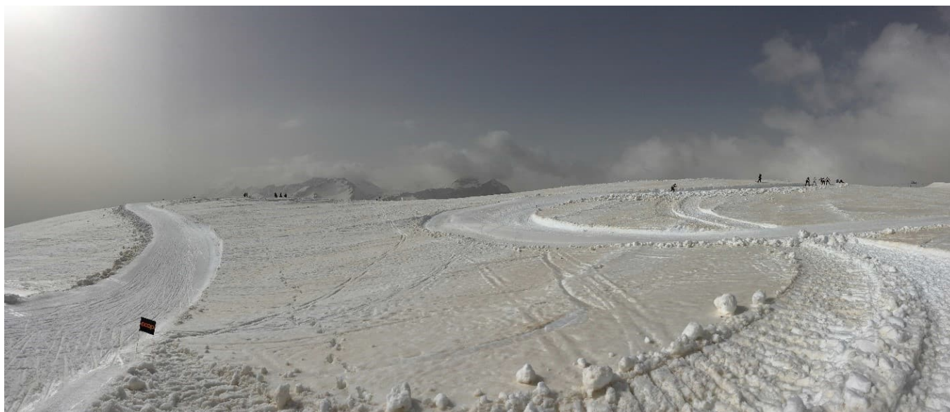
Der improvisierte Langlauf weist einige Steigungen und Kurven aus.