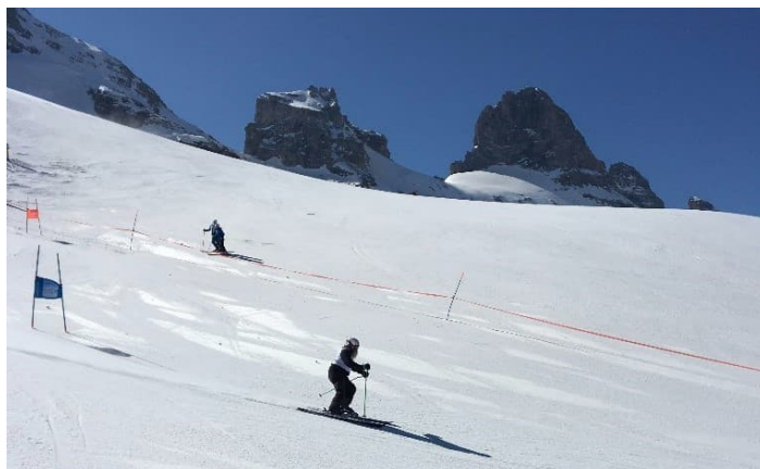
Fritz auf Schussfahrt.